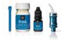
RIVA LUTING PLUS [GI cement modifikovaný pryskyřicí]