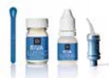
RIVA LUTING [Samotuhnoucí GI cement]